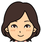
林 希美子 僕のヒーローアカデミア