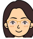
大場 夏枝 ハイキュー!