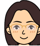
大場 夏枝 ハイキュー!