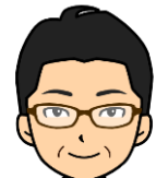
浅尾 陽一 スラムダンク