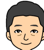
福友 幸博 銀河鉄道999