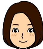
三輪 しのぶ 進撃の巨人