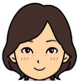
林 希美子 僕のヒーローアカデミア