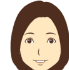
三輪 しのぶ ハリネズミ