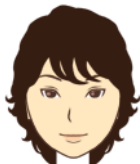
林 希美子 魚を食べているときのコツメカワウソ