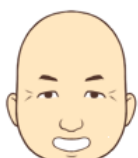
林 浩治 猪八戒 (ちよはつか)