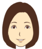
三輪 しのぶ ねこちゃん動画の視聴